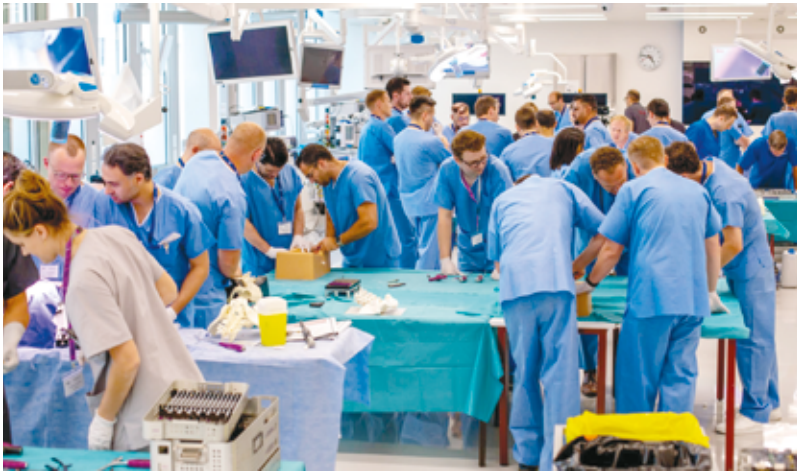
Ateliers pratiques en neurochirurgie, organisés à la SFITS

L'enseignement de la chirurgie était autrefois simple. La philosophie de Halsted (1852-1922) était « See one, do one, teach one », et pendant la majeure partie des XIX e et XX e siècles, cela semblait être la voie à suivre. À l'époque, les étudiants en chirurgie allaient même jusqu'à payer leur maître pour l'expertise pédagogique qu'il dispensait.