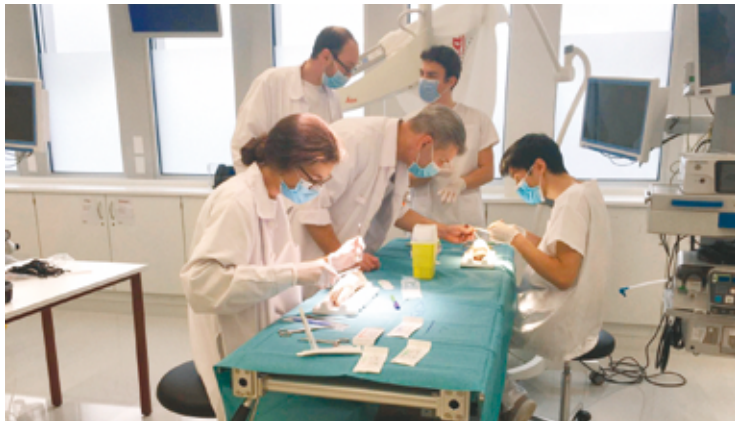
Atelier pratique de suture en chirurgie cardio-vasculaire, organisé à la SFITS

interventionnelles au gré du développement de l'instrumentation. Enfin, les technologies d'assistance chirurgicale robotique ou «cobots» ont envahi les salles d'opération. Dernièrement, l'intelligence artificielle, menace selon les uns ou panacée selon les autres, est sur le point de saturer nos activités à tous les niveaux. Nous sommes courageusement entrés dans le XXI e siècle pour constater que non seulement la technologie avait changé les pratiques mais que, parallèlement, la société se transformait. L'éthique du travail a évolué, l'individu et ses besoins tendent désormais à supplanter les nécessités sociétales. Les horaires de travail se sont rétrécis. Loisirs et temps libre sont devenus prioritaires. De surcroît, le poids de l'économie, de l'administration et de la réglementation pèse de plus en plus sur la pratique médicale. Nos professions chirurgicales et interventionnelles ont rapidement dû se rendre à l'évidence que si la santé n'avait pas de prix... elle avait un coût.